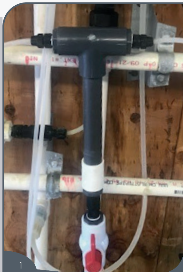
1 Uma câmara “em linha” fornece melhor tempo de reação para o dióxido de cloro.